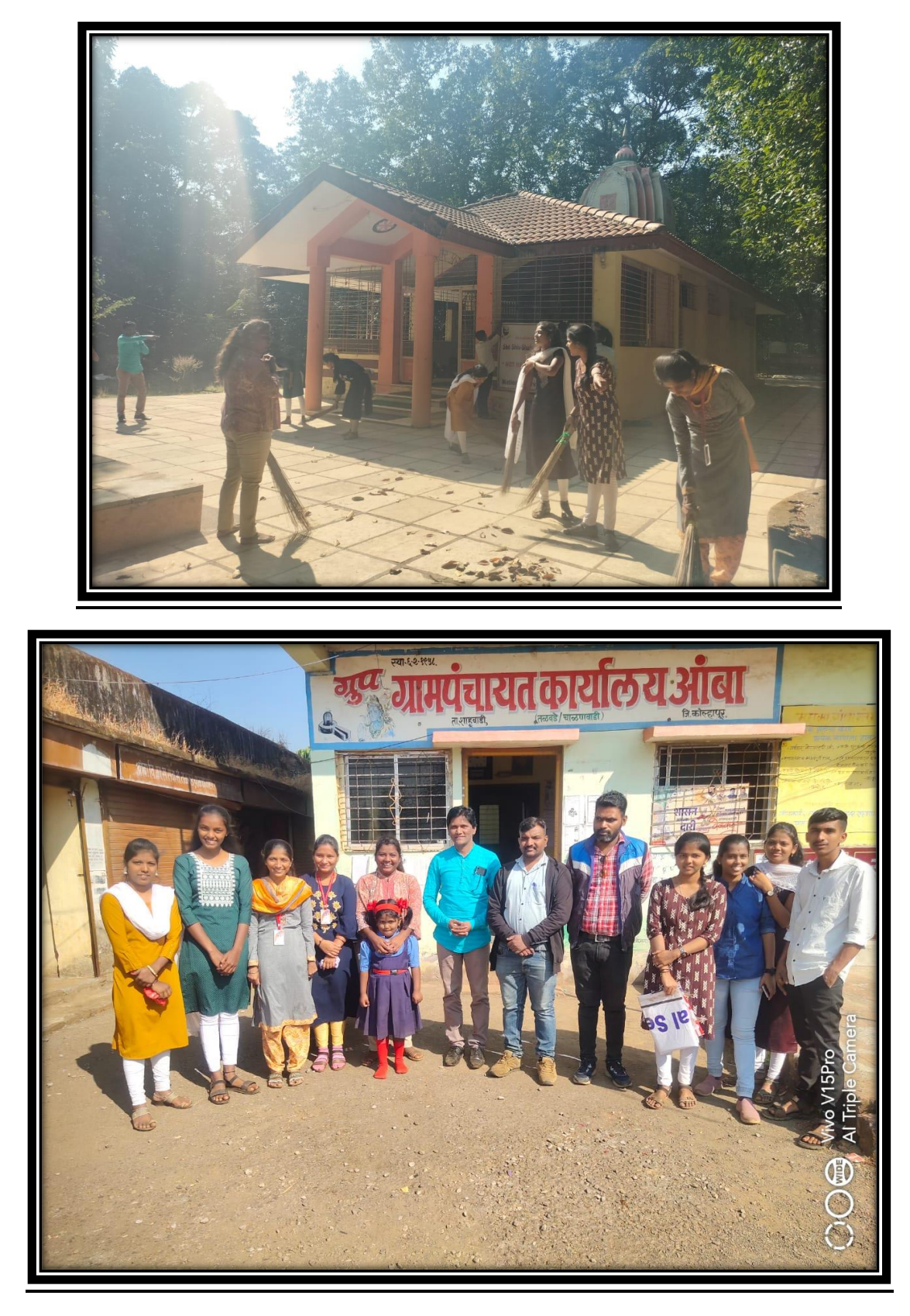
Amba Tourism Area Cleanliness Drive